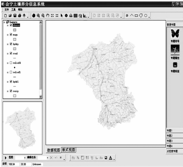
图3 会宁县土壤养分信息系统运行界面

会宁县土壤养分信息系统的登录界面和运行主界面如图3。主界面由菜单栏、工具栏、图层控制器、全局鸟瞰视图器、Map地图、状态栏组成。